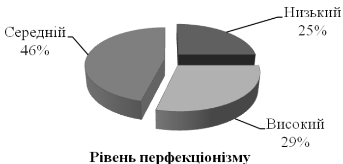
Рис. 1. Розподіл досліджуваних студентів за рівнем перфекціонізму

Результати первинного статистичного аналізу рівня перфекціонізму студентів наведено на рис. 1.