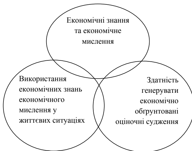
Рис. 1. Тривимірне визначення поняття «економічна компетентність»

Таким чином, поняття «економічна компетентність» може бути подане у вигляді тривимірної схеми (рис. 1).