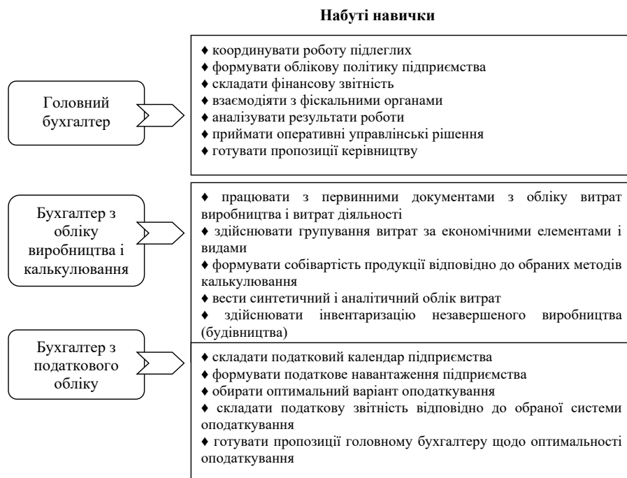
Рис. 2. Функціонально-рольова модель напрямку «Облік і оподаткування»

Детальніше напрям «Облік і оподаткування» характеризує його функціонально-рольова модель (рис. 2).