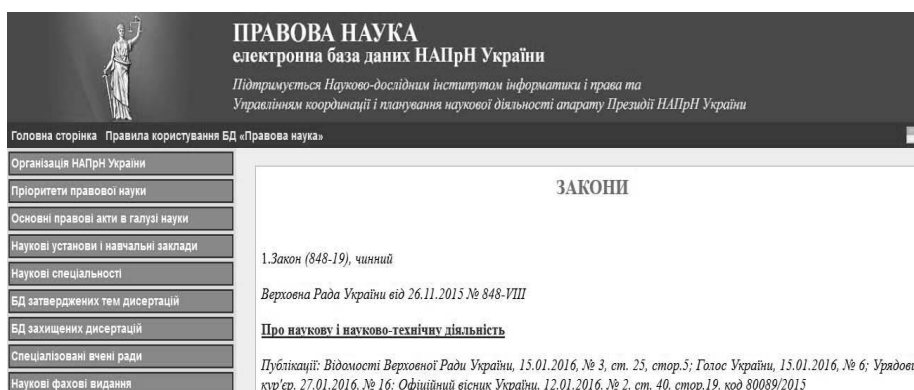
Рис. 4. Інтерфейс пошуку на сайті Правова наука законів

Застосування нестандартних занять при викладанні курсу трудового права – у формі рольової гри. Проектуючи та моделюючи ті чи інші ролі, студенти отримують навички та вміння відповідної поведінки, яка наближає їх до реальної практики. Велику допомогу надають інформаційні ресурси, наприклад: інтернет-ресурс «Правова наука».