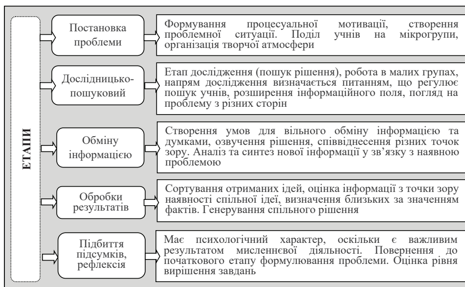
Рис. 2. Структура уроку-дослідження

Головним результатом такого уроку має стати інтелектуальний продукт, що виявляє певну істину в результаті дослідження.