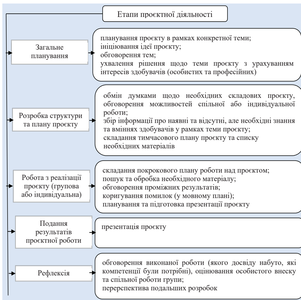
Рис. 1. Етапи проектної діяльності

У процесі формування полікультурної комунікативної компетентності майбутніх фахівців у галузі туризму проектну діяльність реалізуємо відповідно до певних етапів (рис. 1).