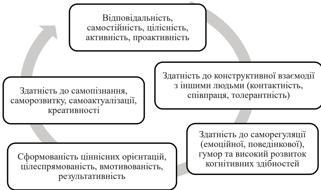
Рис 2. Психологічні характеристики психологічної зрілості

Узагальнюючи отримані результати, вважає за необхідне зазначити, що психологічна зрілість – це багатогранна характеристика особистості, яка містить у собі певні блоки, наведені у схемі рис. 2.